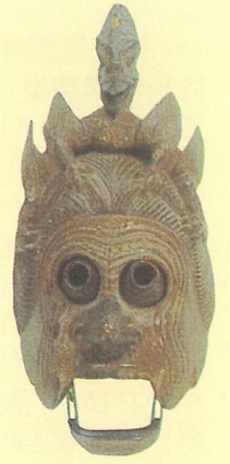
重文「陵王」面 真清田神社蔵