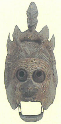
重文「陵王」面 真清田神社蔵