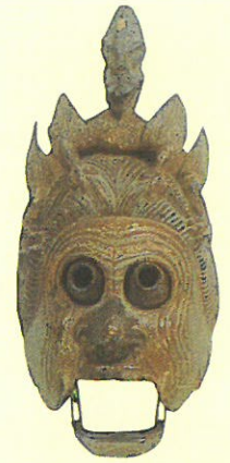
重文 「陵王」面 真清田神社蔵