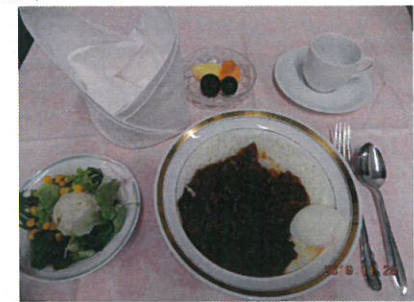
例会メニュー ハヤシライス 例会変更案内

皆様からのご寄付で世の中を良くするためのさまざまなロータリー活動が行われています。今後ともロータリー財団へのご理解ご支援をよろしくお願ひします