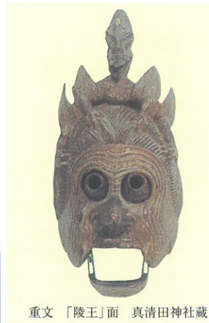
重文「陵王」面 真清田神社蔵