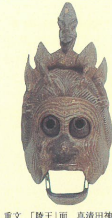
重文「陵王」面 真清田神社蔵