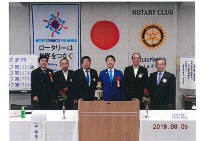
「日本のロータリー100周年記念の鐘」を囲んで