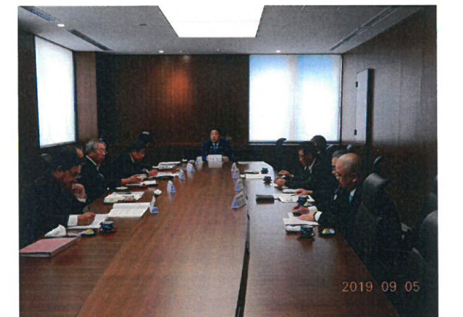
4階特別会議室 4RC会長幹事懇談会

本クラブの目的は、「ロータリーの目的」の達成を目指し、五大奉仕奉仕部門に基づいて成果あふれる奉仕プロジェクトを実施し、会員増強を通じてロータリーの発展に寄与し、ロータリー財団を支援し、クラブレベルを超えたリーダーを育成することである。