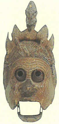
重文 「陵王」面 真清田神社蔵