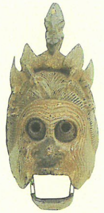
重文「陵王」面 真清田神社蔵