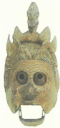
重文「陵王」面 真清田神社蔵