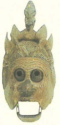
重文「陵王」面 真清田神社蔵