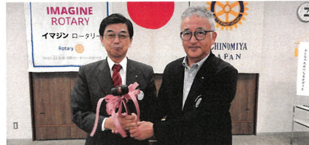
例会終了後、関戸会長より、次年度、足立会長予定者にゴングの引継ぎがありました。