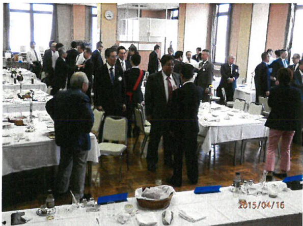
2人ペアになり自分のタイプを確認