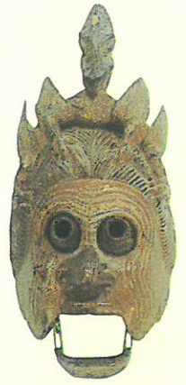
重文「陵王」面 真清田神社蔵